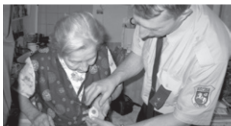
■ Policisté seznamují seniory s nouzovým tlačítkem. Mělo by jim pomoci v nesnázích

Před rokem zahájila Městská policie Ostrava instalace prvních nouzových tlačítek v bytech seniorů a zdravotně či tělesně hendikepovaných osob v rámci projektu Senior linka. Celkem 173 zařízení bylo postupně instalováno v bytech zájemců, kteří splnili dané podmínky (věk, zdravotní či tělesná indispozice, osamělost). Z tohoto počtu jsou aktuálně 2 zapojena u občanů městského obvodu Radvanice a Bartovice. Zájem ze strany veřejnosti však předčil naše očekávání. Bohužel nemůžeme v současné době uspokojit všechny zájemce. Kromě těch, kteří již mají nouzové tlačítko doma nainstalováno, evidujeme dalších 114 zájemců, kteří na to „své“ zařízení teprve čekají. Také v obvodu Radvanice a Bartovice na volné zařízení čeká 1 zájemce. Z tohoto důvodu jsme byli nuceni příjem dalších žádostí pozastavit. Vyvíjíme však aktivitu