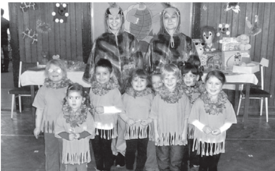
■ Děti v kostýmech vypadaly naprosto spokojené