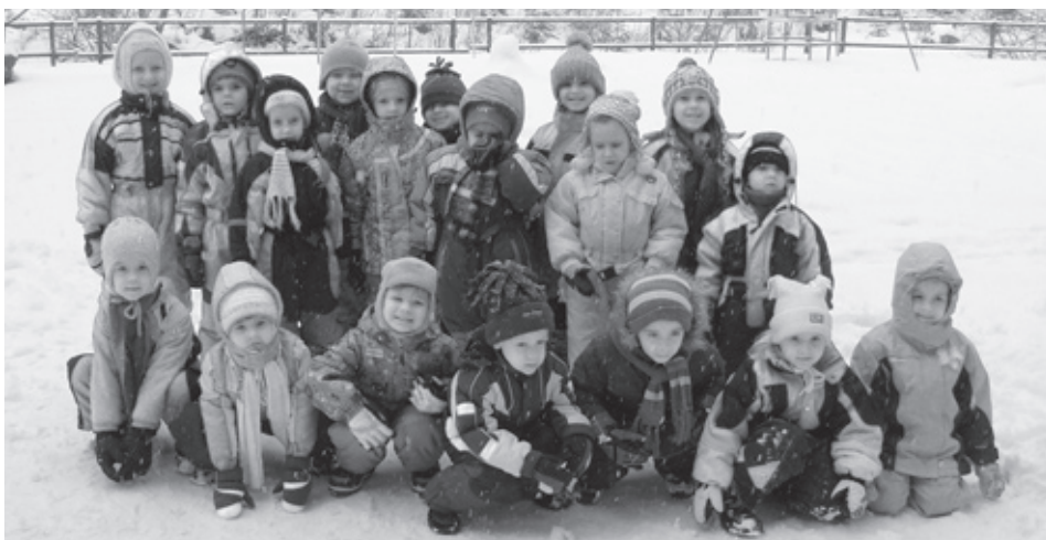
■ Skupinové foto na závěr nemohlo chybět

Byl název a téma týdenní zimní školky v přírodě, které se zúčastnilo 18 dětí z mateřské školy Za Ještěrkou ve věku od 3 do 6 let. Ubytování byly v malebném koutě Beskyd, na horské chatě Karolinka. V týdnu od 17. do 22. ledna děti prožívaly dobrodružství se zvířecími kamarády z Madagaskaru a plnily různé úkoly. Zebře Mártu malovali pruhy, žirafě Melmenovi vyráběli šálu, lvu Alexovi vytvořily krásnou hřívu. Děti našly a zachránily poklad krále Jelimána, který mu vzali a v lese ukryli lesní skřítky. Zvířecím kamarádům postavily krásné igly. Počasí nám celý týden přálo a děti si na vycházkách do okolí