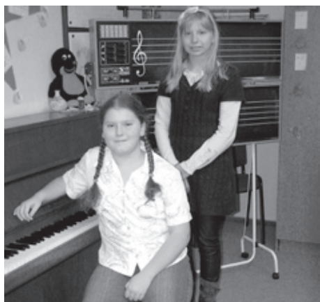
■ Všem postupujícím držíme palce

Na přelomu ledna a února proběhla školní kola soutěže základních uměleckých škol, kterou každoročně vyhlašuje Ministerstvo školství, mládeže a tělovýchovy.