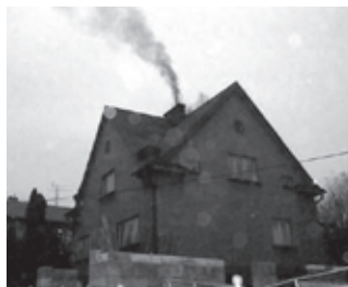
▲ Fotografie pořízena dne 17. 2. 2011 na ulici Lipinská v Ostravě-Radvanicích v 17.25 hodin