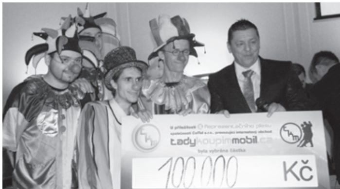
■ Předání šeku Klaunům z Balónkova na částku 100 000 Kč Foto Bc. Šárka Tekielová, organizátorka