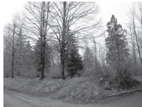
■ V parku se vykácejí staré stromy a vysadí nové dřeviny. Foto Dagmar Hrnčárková

dřeviny, dále se v zájmovém území nacházejí dřeviny, které vyžadují pěstební opatření, výchovný řez, ošetření poranění, u keřů zmlazení. V rámci výsadby dřevin, včetně údržby, bude provedeno doplnění probírkou uvolněných ploch parku novými výsadbami. Realizace projektu tedy zahrnuje celkem dosadbu 24 ks dřevin, z toho 14 ks keřů, 10 ks stromů a ošetření 46 ks dřevin. Současně bude provedena obnova chodníků s povrchem z mlatu o šířce 1,5 m v původních trasách a zároveň upravena vstupní plocha do parku. Tato část projektu je dofinancována z rozpočtu statutárního města Ostravy. Zahájení prací je v únoru 2011 a předpoklad ukončení v dubnu 2011. Realizaci díla bude provádět na základě výběrového řízení Ing. Jan Mareš – Parkservis, se sídlem Zahradní 84, 747 19 Bohuslavice.