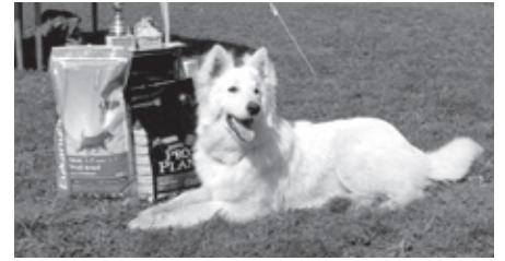
■ Vítěz 2. ročníku: bílý švýcarský ovčák Bela